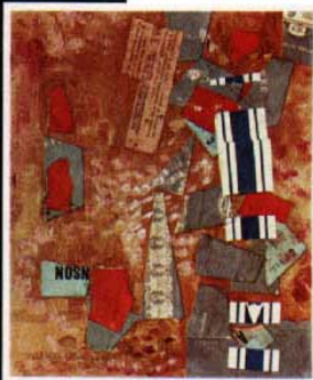
"L'ARNAVAL BLANCO", KURT SCHWITTERS