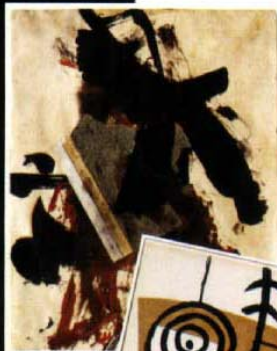
FRANZ KLINE, SIN TÍTULO