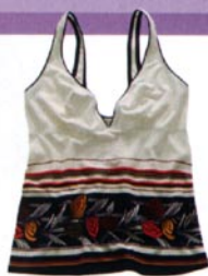
Conjunto de camiseta de tirantes (19,90 €) y boxer (9,90 €) con flores, de Women' Secret .