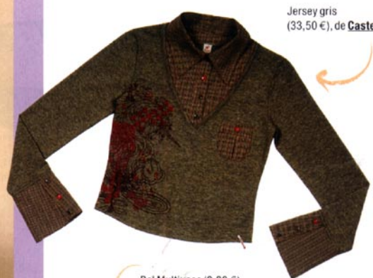
Jersey gris (33,50 €), de Caster .

puesto de moda. Ropa, decoración, coches, cine, series de televisión... todos los sectores parecen haber vuelto la mirada al pasado en busca de ideas. Esa recuperación de elementos característicos de décadas anteriores, pero pasadas por el filtro actual, parece no tener fin y sus adeptos son cada vez más. Para ellos, esta selección de regalos.