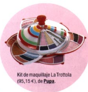
Kit de maquillaje La Trottola (95,15 €), de Pupa .

Para los que se apuntan a las tendencias del pasado... más actuales.