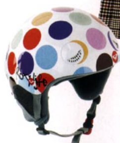
Casco de snowboard con lunares (70 €), de Roxy .